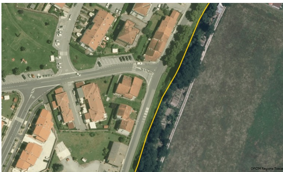
Il contesto urbanizzato in cui si inserisce la variante

La variante infine non comporta una variazione nelle condizioni di pericolosità e fattibilità dal punto di vista delle indagini geologiche già condotte ai sensi del Regolamento Regionale n. 53/R del 2011.