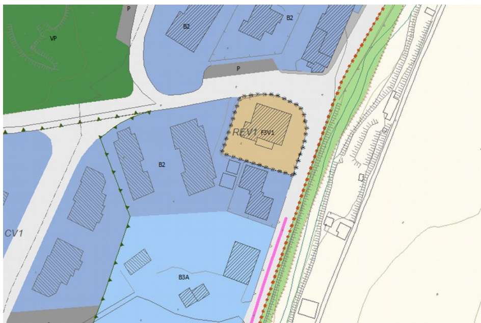
Estratto da Regolamento Urbanistico vigente

La presente relazione è allegata alla proposta di variante alle Norme Tecniche di Attuazione di Regolamento Urbanistico vigente relative all'ambito di recupero REV1 di Vacchereccia.